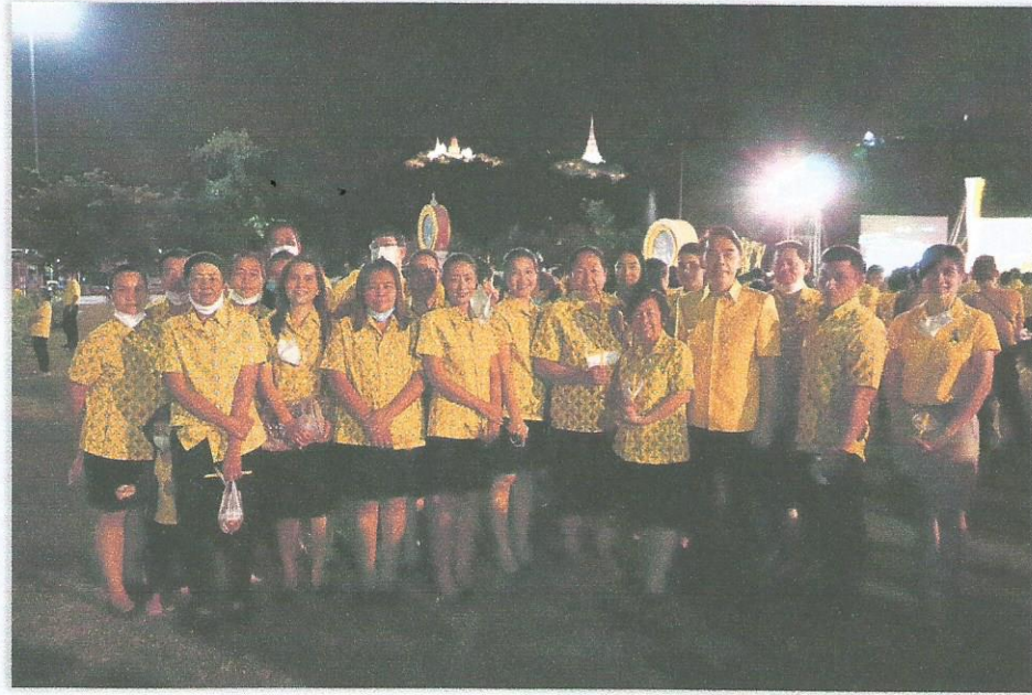
◇ กิจกรรมจุดเทียนน้อมรำลึก ในวันที่ ๕ ธันวาคม ๒๕๖๓