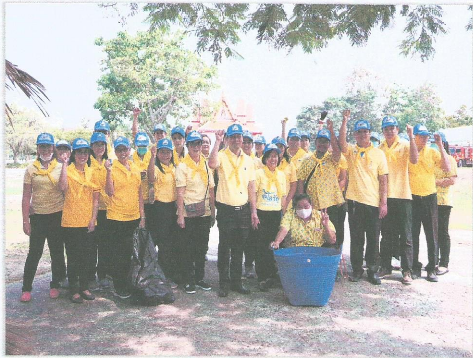
◇ กิจกรรมจิตอาสา พัฒนาบริเวณศาลหลักเมืองทุกวันศุกร์

๒. มีความรักความสามัคคี สำนึกตระหนักถึงส่วนรวมเป็นหลักช่วยเหลือสังคมและส่วนรวม ร่วมมือร่วมใจในการปฏิบัติงาน จะเป็นกิจกรรมที่ต้องทำด้วยความสามัคคีกลมเกลียว อาทิเช่น การร่วมแข่งขันกีฬา สันนิบาตเทศบาลจังหวัดเพชรบุรี การจัดกิจกรรมวันเทศบาล การให้ความร่วมมือในการเข้าร่วมกิจกรรมงานพิธีต่างๆของจังหวัดเพชรบุรี การใช้สัญลักษณ์ที่เป็นวัตถุเครื่องแบบการแต่งกายที่เหมือนกันในการทำกิจกรรมต่างๆ เป็นต้น