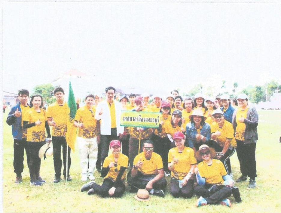
◇ กิจกรรมกีฬาसनินิบาตเทศบาลจังหวัดเพชรบุรี

๓. ใช้เทคโนโลยีที่เหมาะสมกับศักยภาพท้องถิ่น มีการสร้างสรรค์ในระบบเทคโนโลยีสมัยใหม่ สร้างสรรค์นวัตกรรมใหม่ๆ อาทิเช่นการสร้างกลุ่มไลน์ในองค์กร และสร้างกลุ่มไลน์ในส่วนการงานต่างๆเพื่อ ประโยชน์ในการสื่อสารที่ถูกต้องและรวดเร็ว